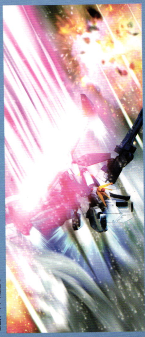
●写真はイメージです。

■GX-9900-DV ガンダムXデバイダー 対バリエーション戦で主要兵器のサテライトキャノンとバウカバックユニットを破壊されたガンダムXは、フリーデンの天才メカニック、キッド・サルビルとメタツクによって「ガンダムXデバイダー」に生まれ変わった。新ユニット「デバイダー」で戦闘時の攻撃・防御能力向上したのみならず、「ホバリングモード時」には、バウカバックの大型可動スラスターと相まって、機動性も大幅に強化されており、MSとしてのスベレツはむしろバウカバックしたと言っても過言ではない。