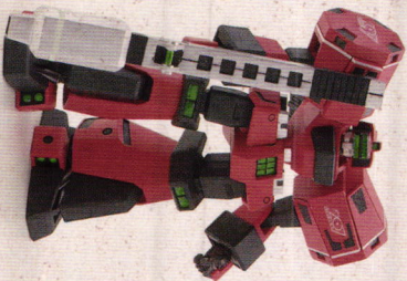
■サルベーン軍曹機にも組み立てられます。