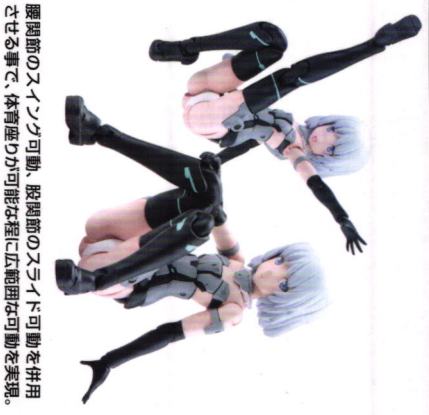
腰関節のスイング可動、股関節のスライド可動を併用させる事で、体骨座りが可能な程に広範囲な可動を実現。