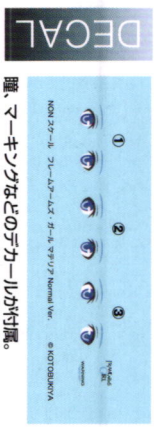
瞳、マーキングなどのデカールが付属。