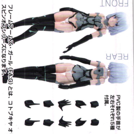
PVC製の手足が左右それぞれ5種付属。