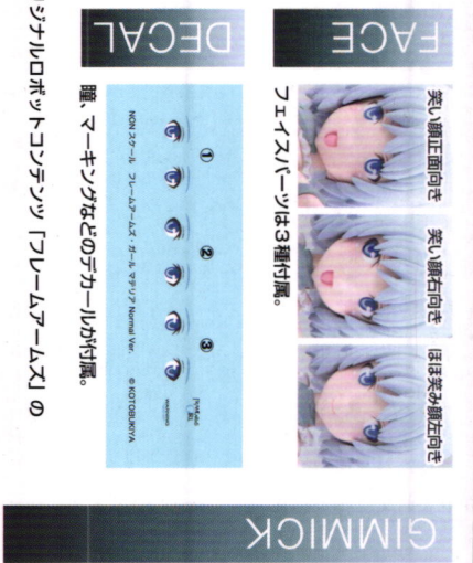
美しい顔正面向き 美しい顔右向き ほほ笑み顔左向き フェイスパーツは3種付属。