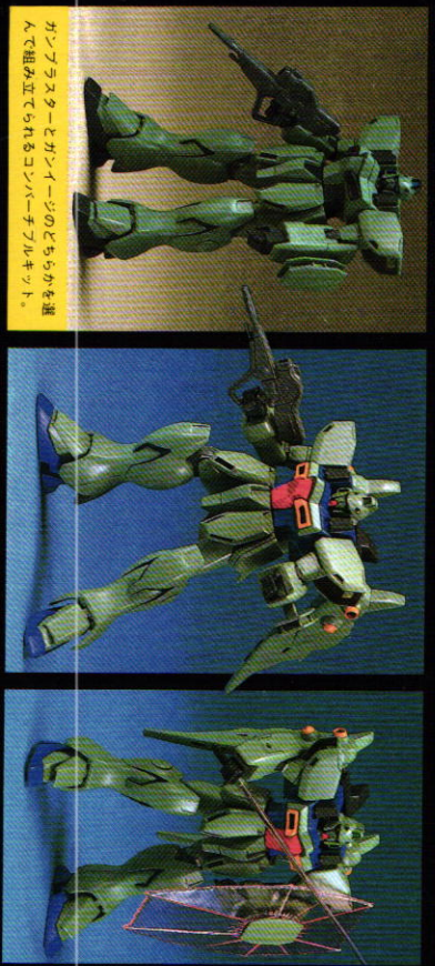
ガンブラスターとガンエージのどちらかを選んで組み立てられるコンバーチブルキット。

【本】要目1772ニメ機動戦士ガンダムシリーズの主役級メガ、ガンエージの宇宙強襲タイプ「ガンブラスター」を、1/100スケールで3D化したプラスチックモデル組み立てキットです。■ガンブラスターとガンエージのどちらかを選択して組み立てる事ができます。■多色成形によって、色分けされたパーツや付属のシールにより設定色に近い仕上がりを楽しめます。■組み立ては、すべてハメ込み式のメカパーツで完了します。■ボールジョイントなどのボウキヤットによって各関節がスムーズに可動。各部スラスターカバや推進節の一部が可動します。■ビームライフル、ビームサーベルをセットしました。■同スケールの1/100F90シリーズの武器を各パーツにに取り付けられることができます。